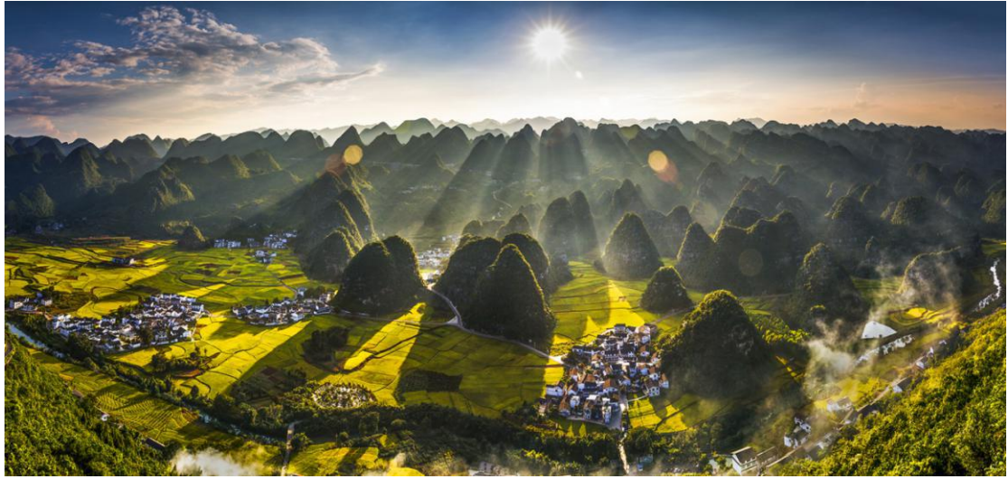
中国最大喀斯特峰林——万峰林