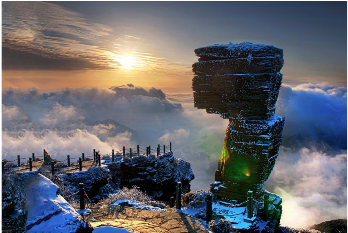
世界自然遗产——梵净山