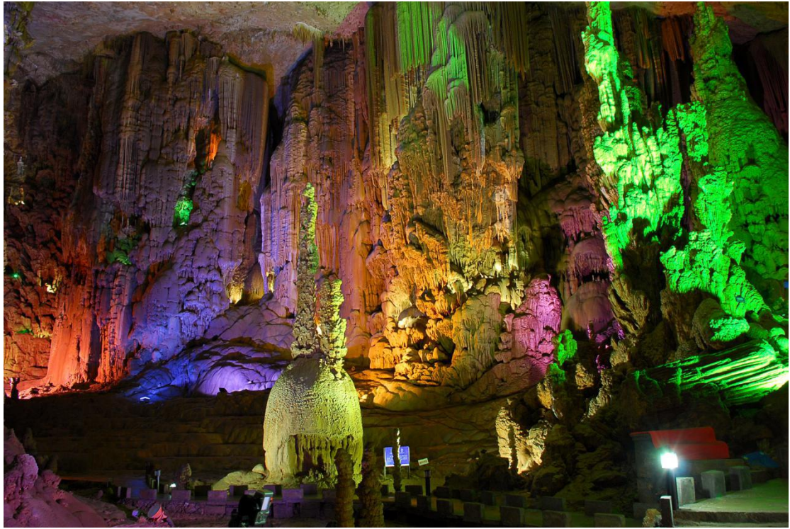
世界地质公园——织金洞