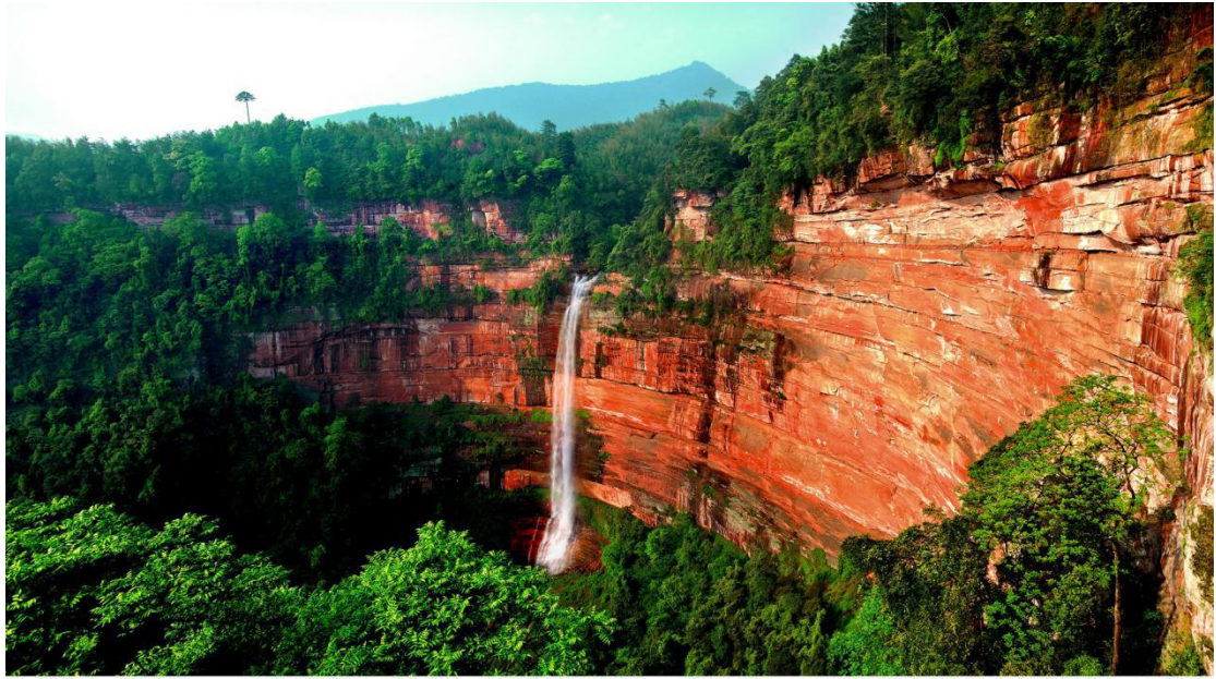
世界自然遗产-赤水丹霞奇观佛光岩