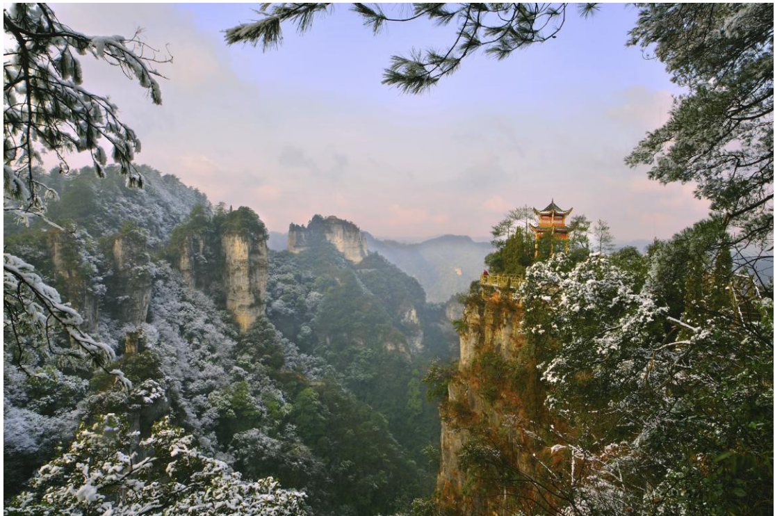
世界自然遗产——施秉云台山