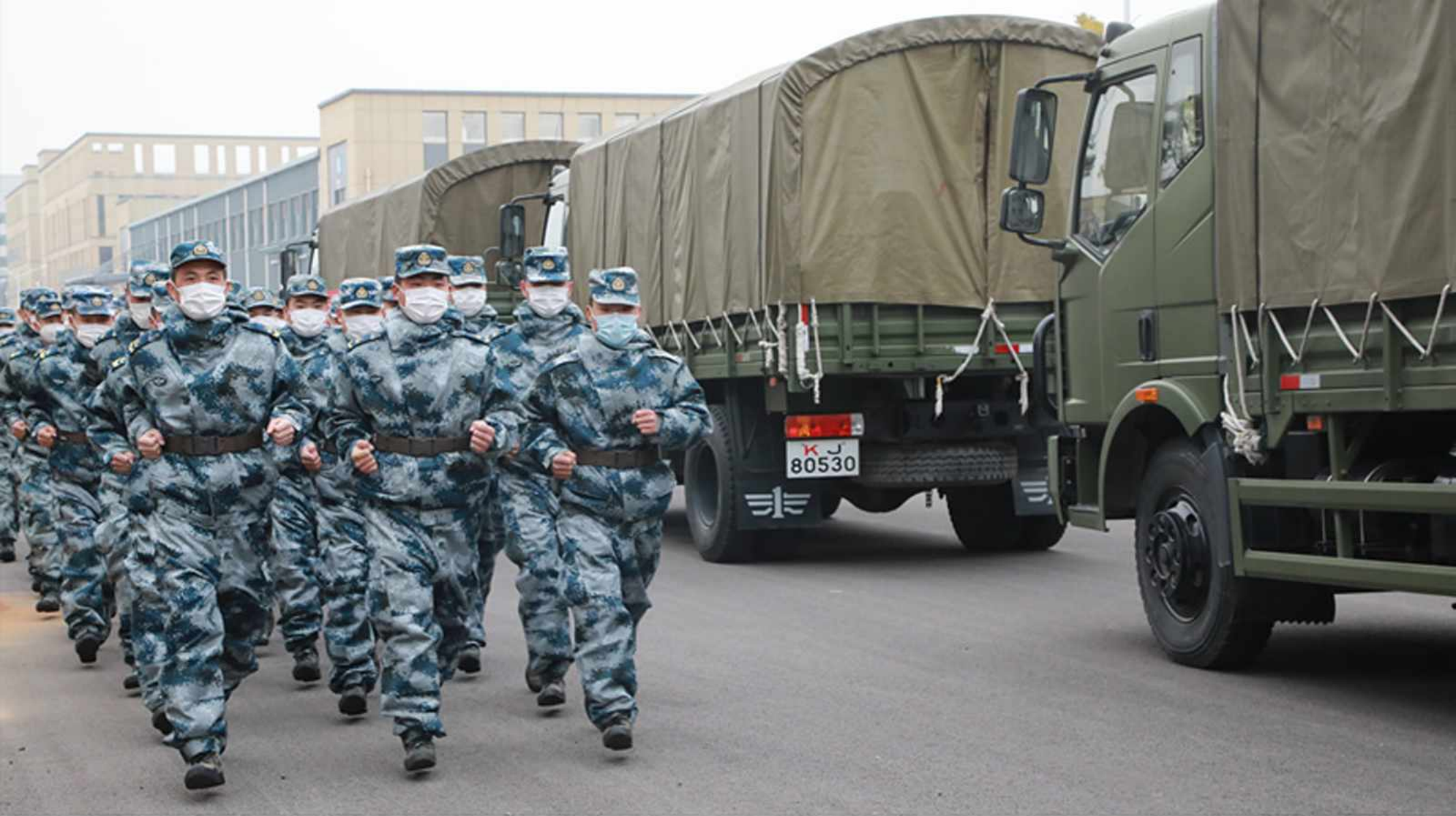
Military transportation personnel rush to distribute living materials in Wuhan.