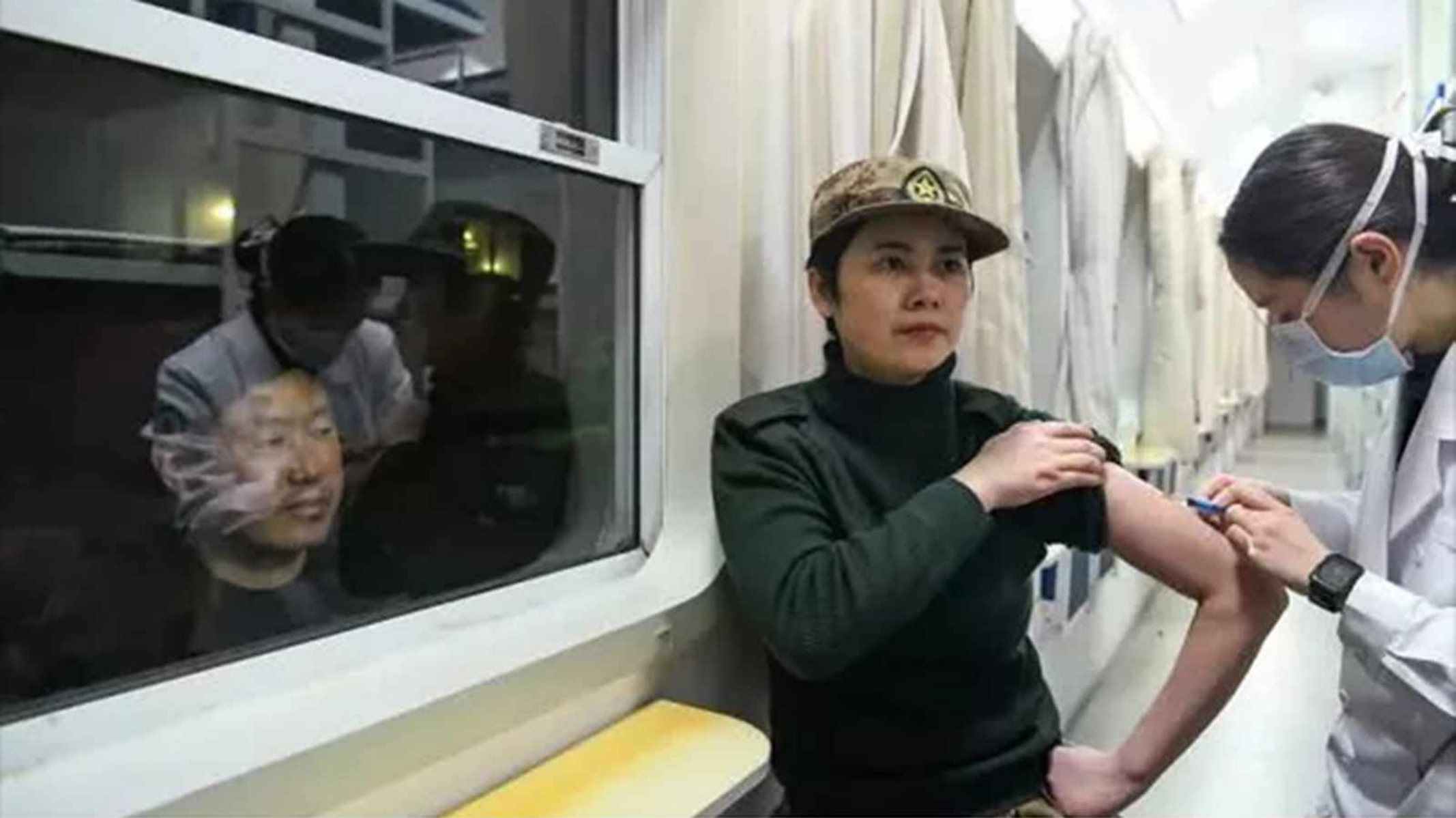
On her way to Wuhan, a military medic gets injected to improve immunity.