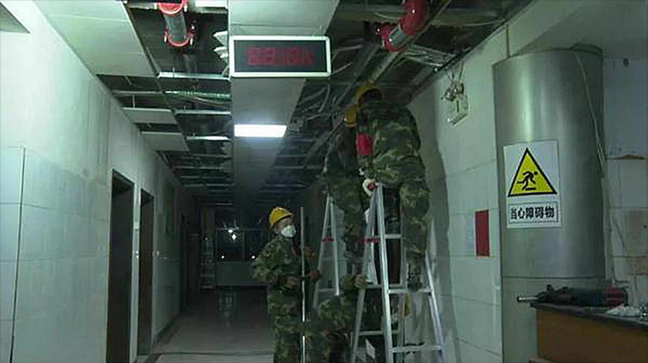
On the evening of the Lantern Festival, soldiers from the PLA Rocket Force help transform a local hospital.