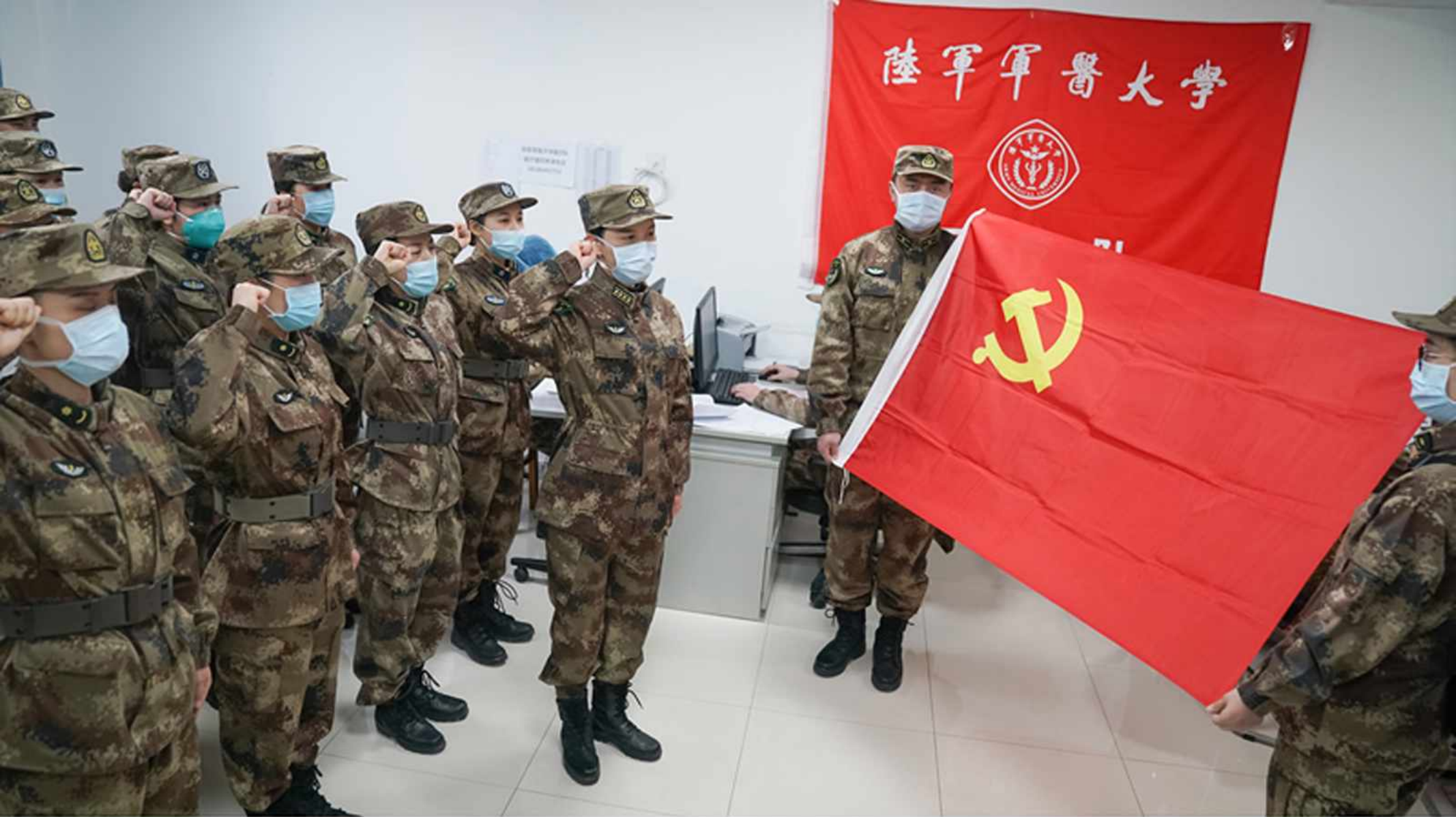
Military medics take an oath before setting for Wuhan.