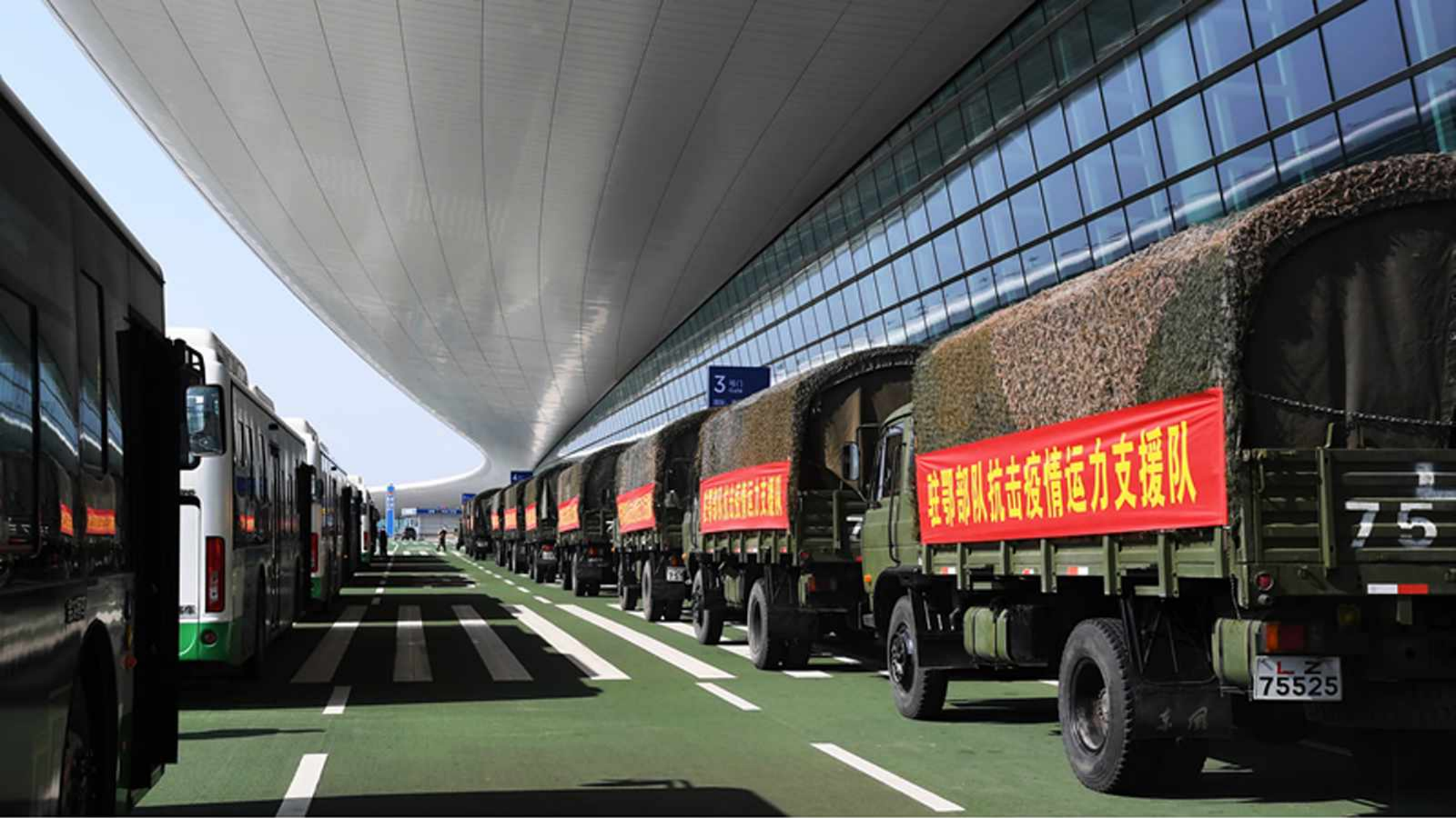
On Feb. 9, troops in Hubei dispatch transportation teams to carry medical equipment and supplies at the Wuhan Tianhe Airport.