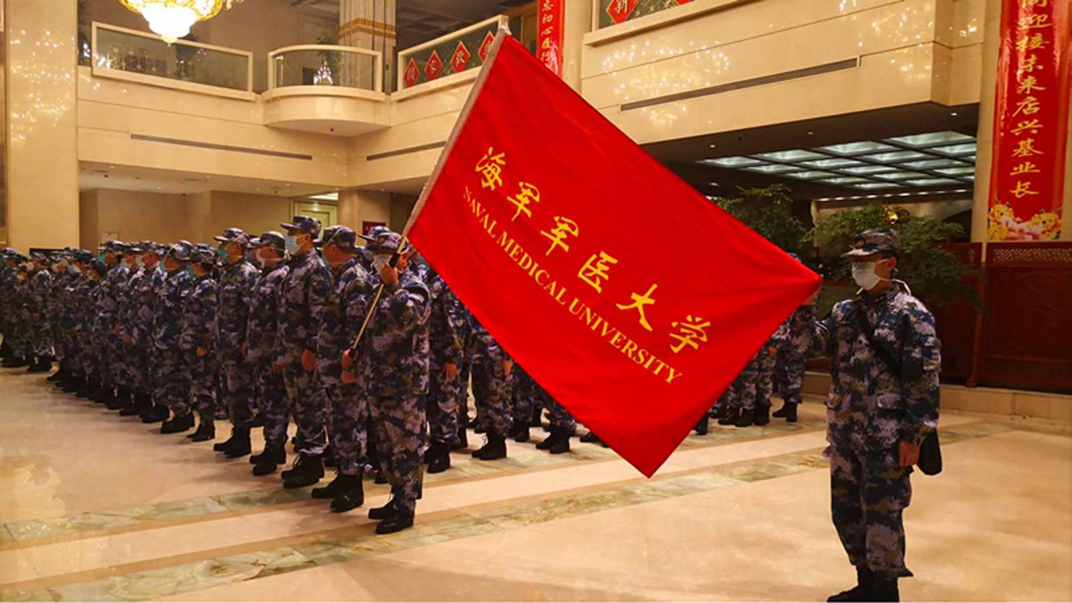
Military medics hold a ceremony before setting for Wuhan.