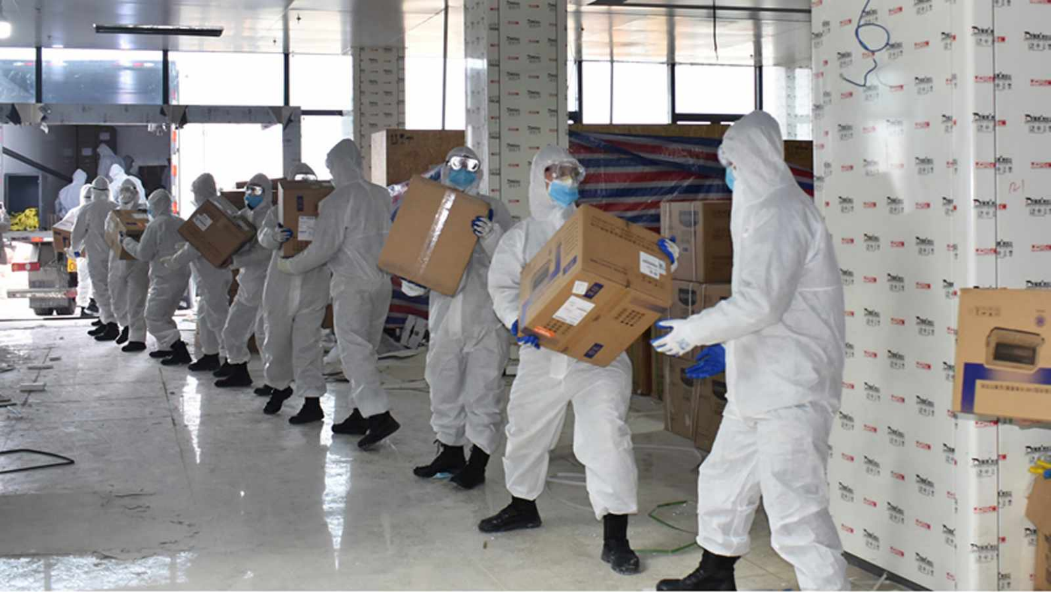
Officers and soldiers of the People' s Armed Police Force (PAP) carry medical materials in Wuhan.