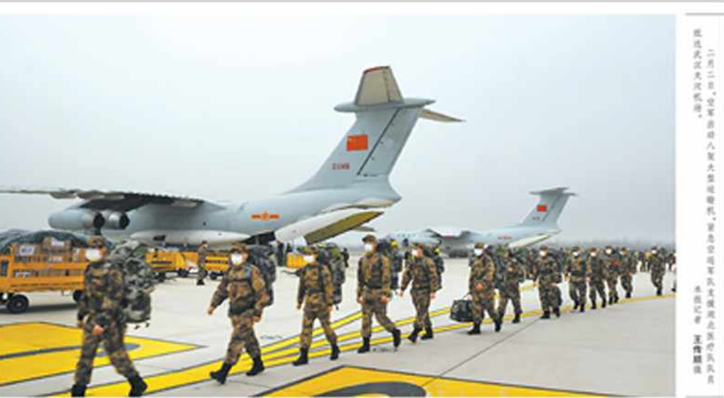
二月二日,空军八架大型运输机紧急空运军队支援湖北医疗队队员和物资抵达武汉火神山医院。

“吃水不忘挖井人,饮水思源。”这次承担武汉火神山医院医疗救治任务的医护人员中,有不少人曾参加过抗非斗争,具有丰富的传染病救治经验。特别是前期抽组的3支医疗队已奋战在武汉3家医院近10天,为保护人民生命安全和身体健康作出了贡献。