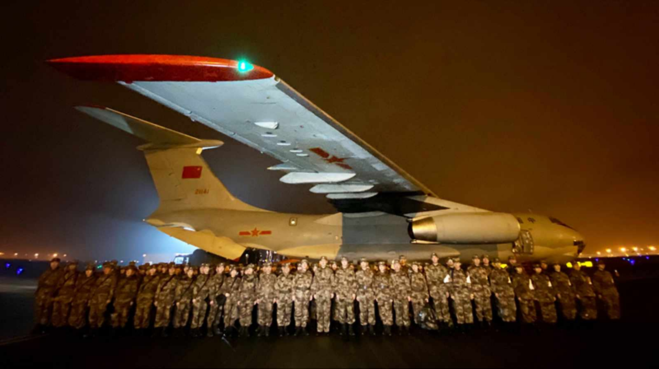
Military medics gather at the airport before flying to Wuhan.